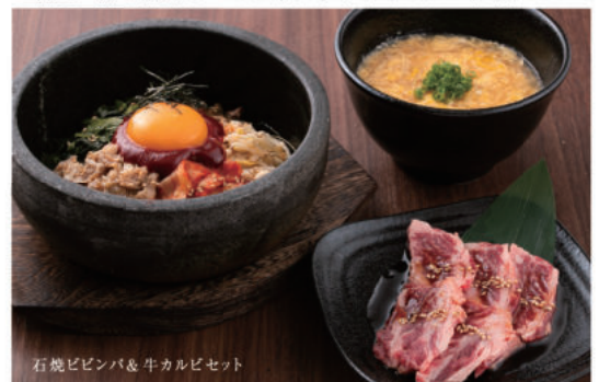
石焼ビビンパ&牛カルビセット