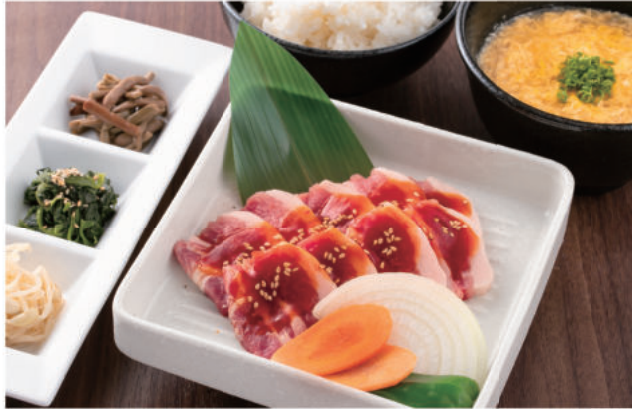
デジカルビ セット