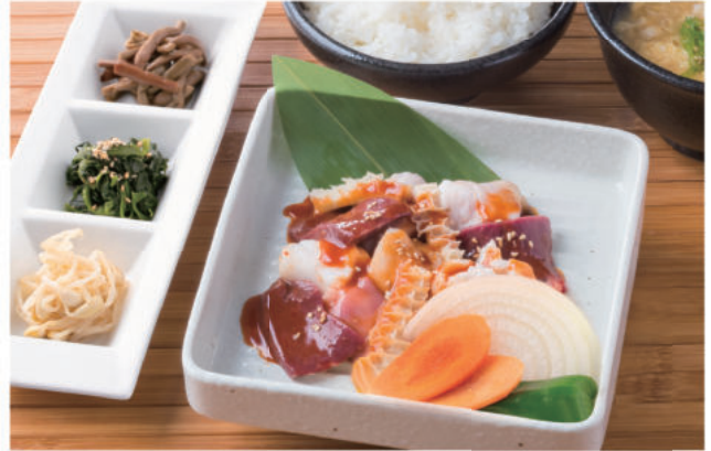
牛ミックスホルモンセット